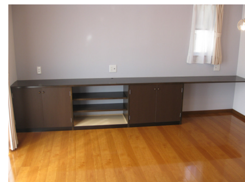
パソコンディスクがこんなに広ーい！オーディオセットも並んでプチオーケストラの集合ダイ♪