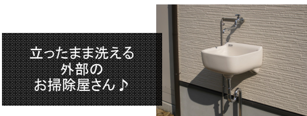
立ったまま洗える外部のお掃除屋さん♪