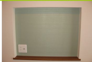
テレビは壁にはめ込む時代！