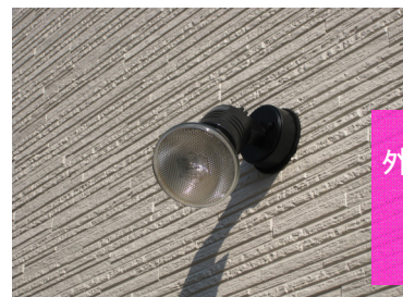
外部のスポットライトは感知式でとても経済的。