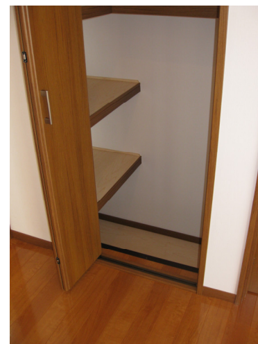
なぬうっ？クローゼットの下まで収納が！！これなら長尺物もOK！！