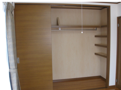
おやっ？クローゼットに引戸が3枚収納？