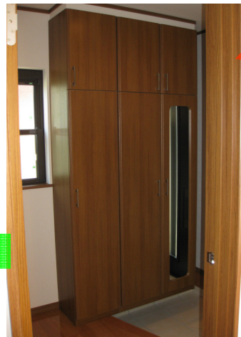
木目の玄関収納は美を追求