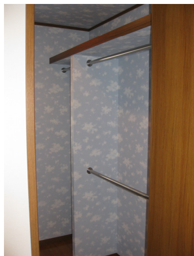
ウォークインクローゼットは、空模様♪無限大の収納を誇ります。