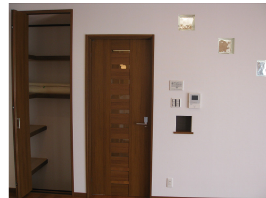
ガラスブロックから光がもれ、ちいさなニッチにはありとあらゆる鍵がかけられます。