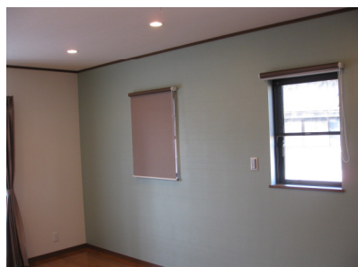
壁紙の色を変える事で目の保養