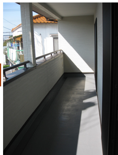
広～いベランダは屋根をかけることで洗濯物も濡れず重宝！