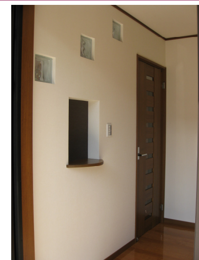
まさに玄関の花！円ニッチは奥行き感のあるシブイ壁紙で家族写真を飾ります★♡