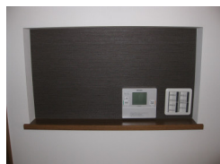
お風呂のタッチパネルとスイッチをはめ込み、絵を並べてアーティスト♪