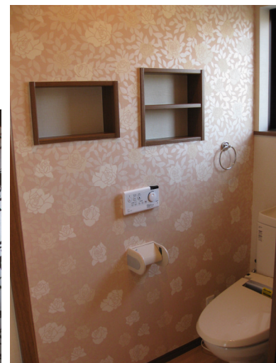
ゴージャスなトイレ姉妹はベルサイユ宮殿の雰囲気