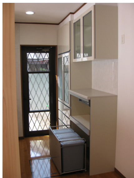
食器棚の下から、便利な分別ゴミ入れの登場ー！！