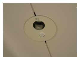
玄関上の感知式門灯は大活躍☆☆