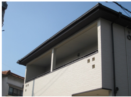
ベランダのくりぬきは三つ葉をイメージ