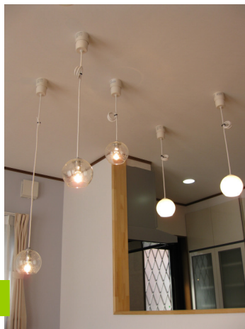
水泡入りの照明はロマンティック