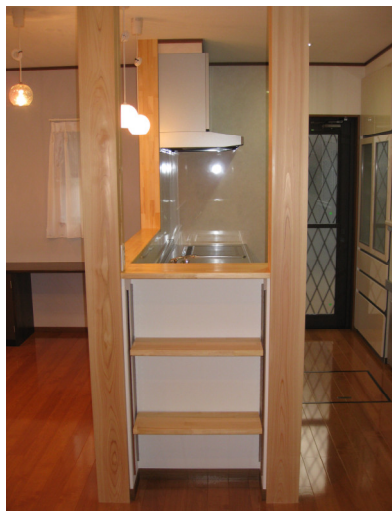
大黒柱2本にはさまれ棚には家宝が飾られます。